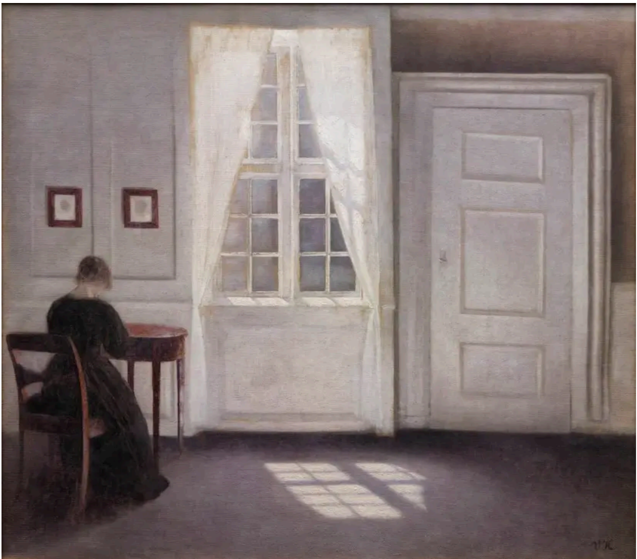
Vilhelm Hammershøi Privatsfære