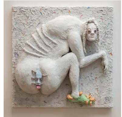
Analtab II (Anal Loss II) (2020) Nanna Starck