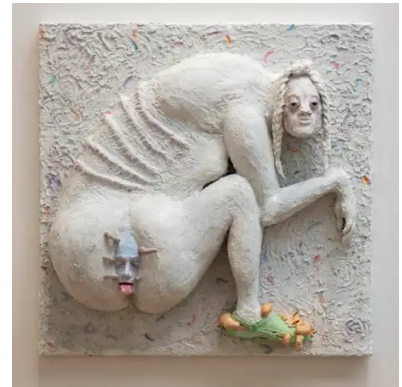
Analtab II (Anal Loss II) (2020) Nanna Starck