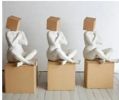
3 x HVID 1:1:1 (1999) Kirsten Justesen