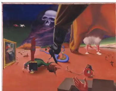
Spildt mælk (1936) Erik Ortvad

Øvelsen kan anvendes alene eller i dit undervisningsforløb med ét eller flere kunstværker. Her kan du finde de kunstværker vi anbefaler til øvelsen.