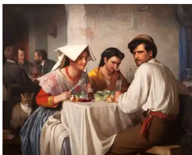
Fra et romersk osteria (1866) Carl Bloch