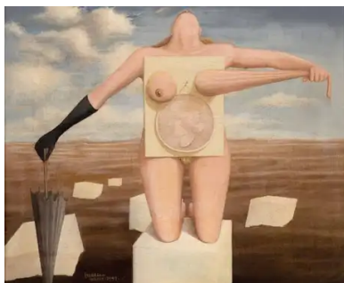
Monument (1941) Wilhelm Freddie