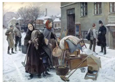
Sat ud (1892) Erik Henningsen