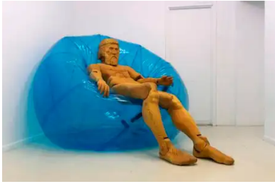
Retired Allfather (2019)