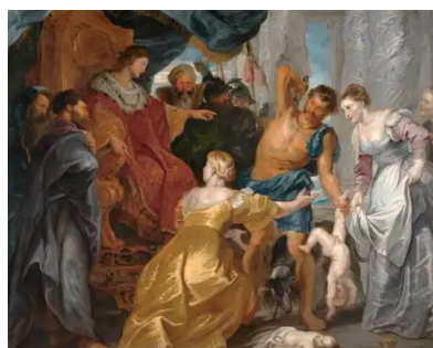
Salomons dom (1615-1618) Peter Paul Rubens