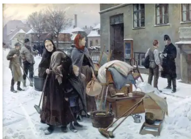
Sat ud (1892) Erik Henningsen