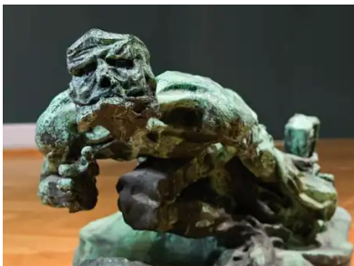
Skyggen (1897-1898) Niels Hansen Jacobsen