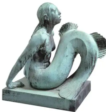
Havfrue (1921) Anne Marie Carl Nielsen