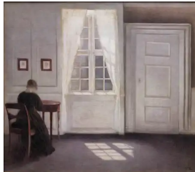
Stue i Strandgade med solskin på gulvet (1901) Vilhelm Hammershøi