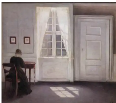
Stue i Strandgade med solskin på gulvet (1901) Vilhelm Hammershøi