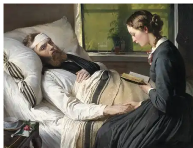
En såret dansk kriger (1865) Elisabeth Jerichau Baumann