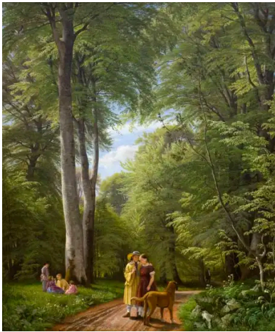
Bøgeskov i maj. Motiv fra Iselingen (1857) P.C. Skovgaard