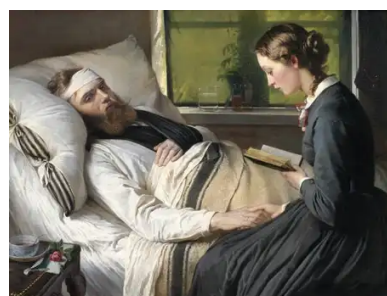
En såret dansk krigs (1865) Elisabeth Jerichau Baumann