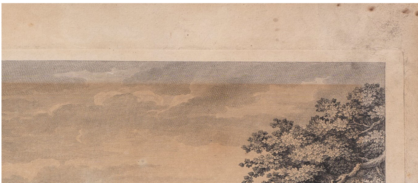
Detalje fra Benoit-Louis Prevost, Overgivelsen af Ili modtages. Billedet viser det øverste højre hjørne af kobberstikket, hvor farveforskellen i papiret er meget tydelig. Når papir får lys, vil det over tid nedbrydes og miste styrke. Et meget tydeligt tegn på nedbrydning er denne gulning af papiret, og i dette tilfælde har kobberstikket tidligere været monteret med en passe partout, der har dækket ind over motivet og dermed beskyttet papiret mod lyspåvirkning. Disse områder fremstår nu uden misfarvning og kan derfor fortælle os, hvordan papiret oprindeligt har set ud.