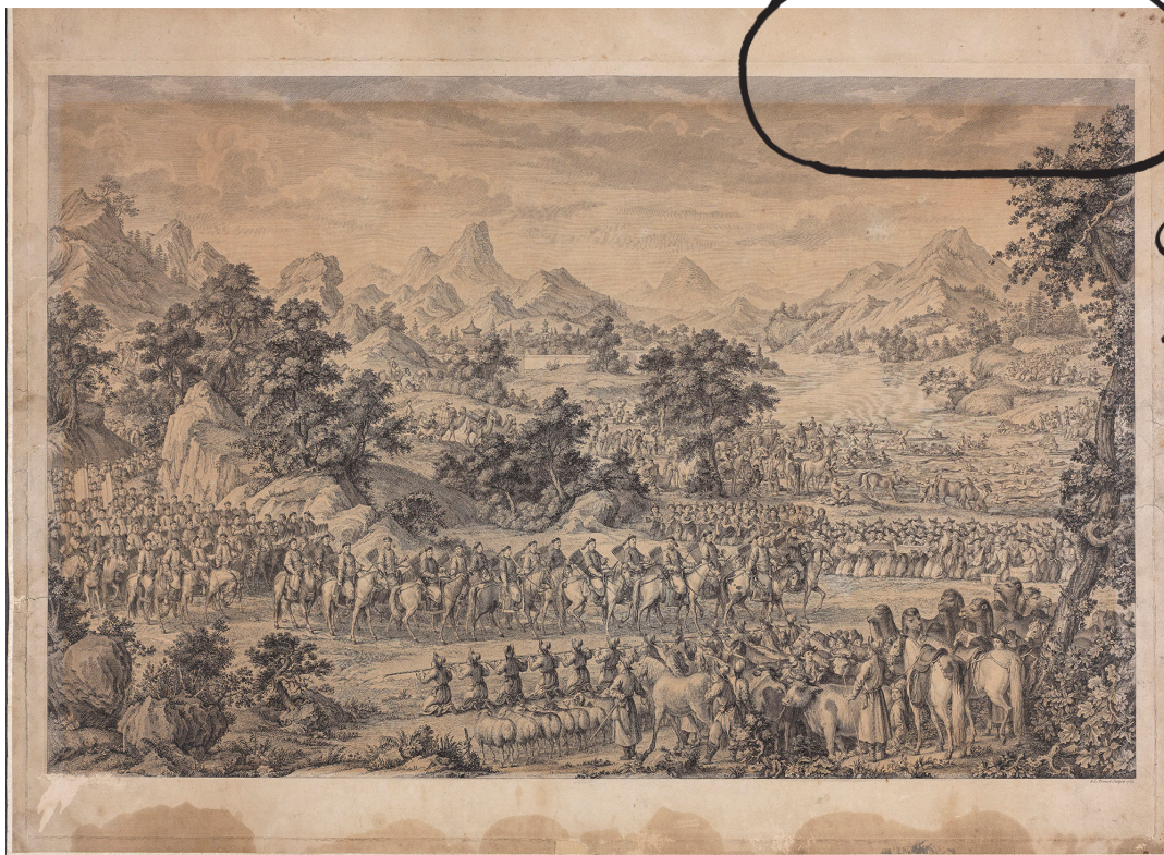
Overgivelsen af Ili modtages, Benoit-Louis Prevost, 1769, radering og kobberstik