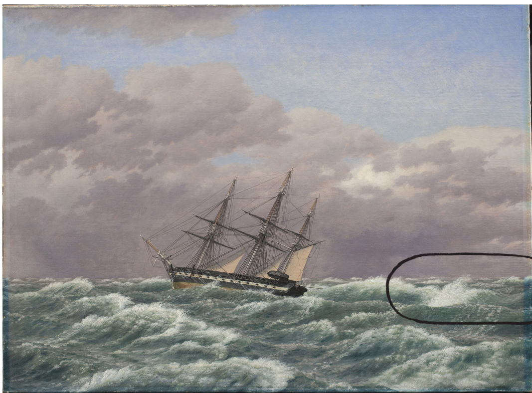
Korvetten "Galathea" i en storm i Nordsøen, C.W. Eckersberg, 1839, Olie på lærred

Her kan du se eksempler på kunstværker, hvor farverne har forandret sig over tid.